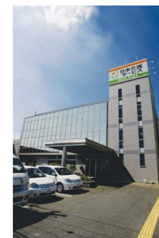
日本介護サービス(株)の社屋。2階で、デイサービスを行っています。

■お問い合わせは… エムシーアクセス・サポート(株) 本社/TEL:03-5302-0625