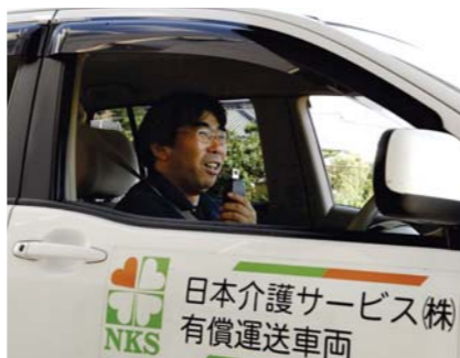
介護タクシーの車両は4種類。利用者様のニーズに合わせて使い分けています。すべての車両にmcAccess e を積載。今では、mcAccess e なしの業務は考えられないほどと。