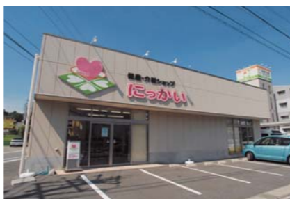
健康・介護ショップ「にっかい」。専門スタッフが、利用される方に最適な用具・用品を選定し、使用方法をアドバイスしています。

サービスのフラット化を目指し、すべての利用者様に、全スタッフが同レベルのサービスができるよう日々研究し、努力されているそうです。