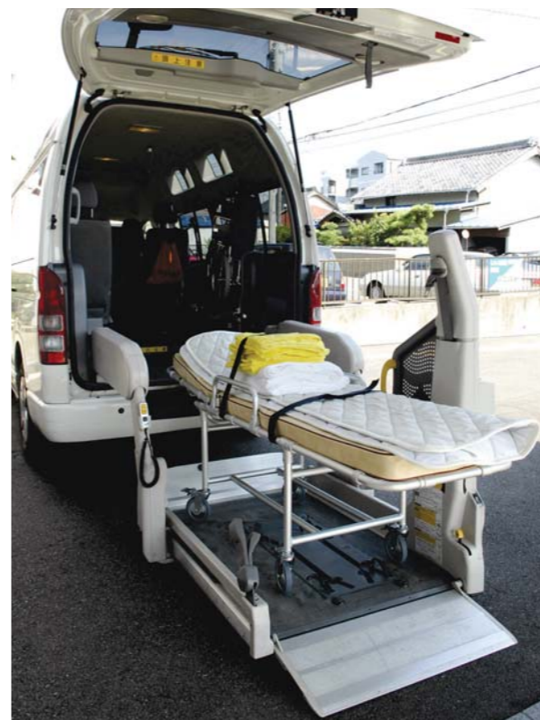
介護タクシーの一種、ストレッチャー対応車。車いすをたたんで、端に収納し、ベッドを入れます。介護タクシーサービスの乗務員は全員ヘルパーの有資格者。病院などへの送迎だけでなく、ベッドから車椅子への移乗、着替え、排泄のお手伝いなどのサービスも行います。