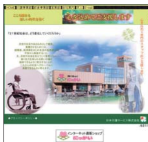
日本介護サービス(株)ホームページ http://www.n-kaigo.co.jp

超高齢社会となった日本では、介護・福祉サービスへのニーズが年々拡大・多様化しています。今回は、mcAccess e と iGPS Mk IV (車両位置管理システム) を併用され、介護タクシーのサービス向上を図られた日本介護サービス(株)様をお訪ねし、導入後の効果とご利用状況についてお聞きしました。