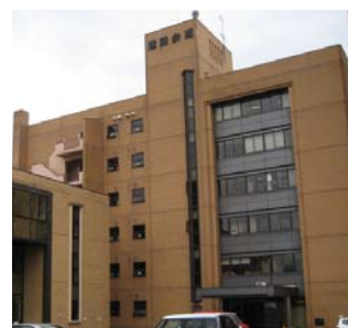
（社）岩手県建設業協会

協会は、岩手県と岩手県地域防災計画に基づき、地震、津波、大雨その他自然現象及び大規模な事故発生時の応急対策業務等への協力協定を以下のとおり締結。