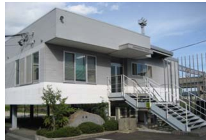
(社)岩手県建設業協会一関支部